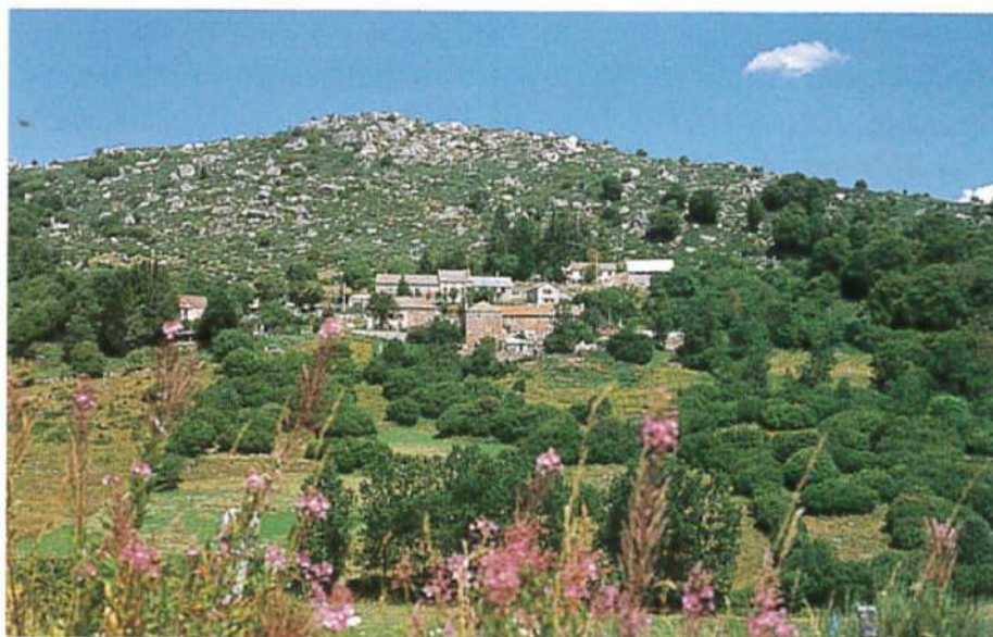
Village de Costeboulès, entre épilobes et granite.

D Du parking, monter dans le village en direction de la ferme des Aurochs (visite guidée de l'élevage et du musée) . Continuer en s'élevant tout droit. 1 Prolonger sur la piste à gauche ( vue sur le village de Costeboulès ). Poursuivre tout droit ( vue, par moments, à gauche, sur la tour de télécommunication du truc de Fortunio ; vue sur la forêt du plateau du Roy ). 2 Au croisement ( croix en pierre ), tourner à droite. Traverser le ruisseau et monter. 3 Emprunter le premier chemin à droite. Continuer tout droit jusqu'à Cos-