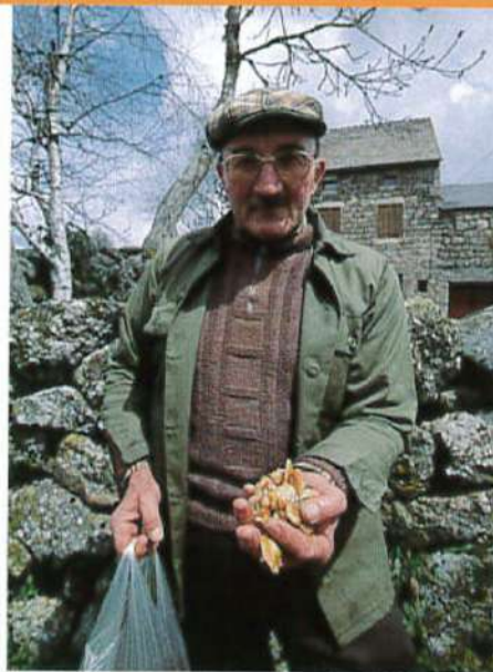
Cueillette de mousserons à Meissouzac.