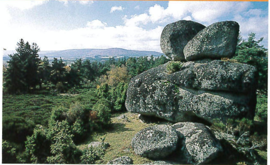
Formation granitique entre Saint-Jean-la-Fouillouse et La Baraque-de-la-Motte.

D Face au monument aux morts de Saint-Jean-la-Fouillouse (église du XIII e siècle avec clocher à peigne trilobé), prendre à droite un chemin qui passe devant un hangar. Monter jusqu'à une croix (vue à droite sur la Haute-Loire : le Devès et, au loin, le massif du